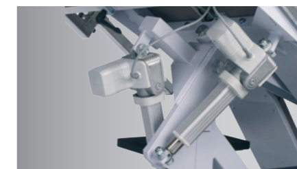
Motorverstellung für „neigen“ und „kippen“