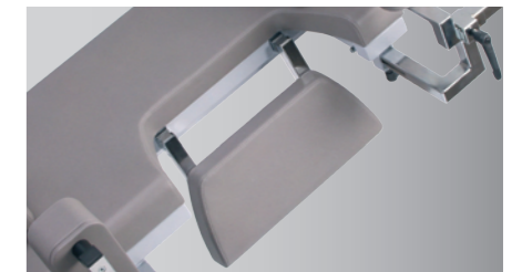
Spezialpolster für Ultraschall-Untersuchung