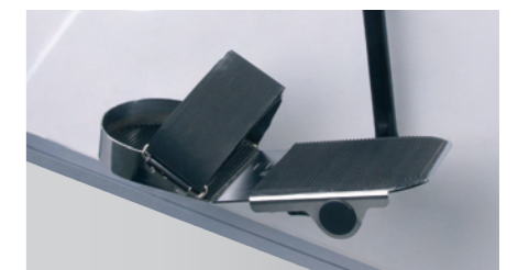
Pedalschuhe mit Klettband-Befestigung