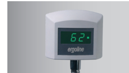
Patienten-Anzeige der Drehzahl